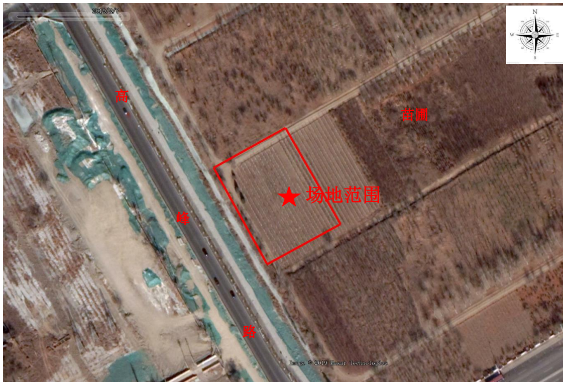
图 0-1 场地交通位置示意图

天津市北辰区龙门道110kV输变电工程位于天津市北辰区龙门东道与高峰路交口北侧，地块面积3500m 2 。场地交通位置示意图见图1.1-1，场地四至范围及坐标见图1.1-2，场地各角点坐标见表1.1-1。