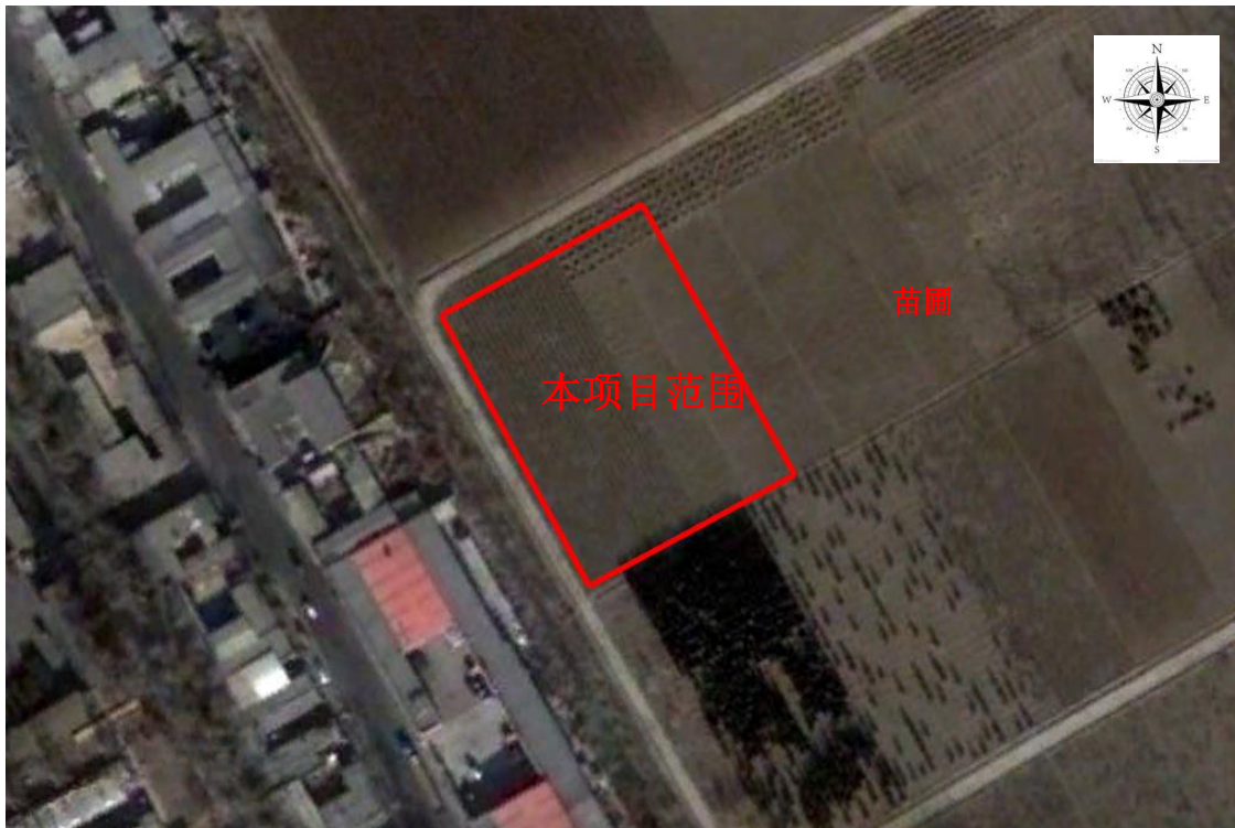
图 1.2-1 历史布局示意图（根据 2004 年 8 月 Google Earth 卫星影像图整理）

通过资料收集、人员访谈及历史地形图和卫星影像资料整理，本项目场地 2019 年之前为天津市花木服务中心北仓苗圃，用于花卉、苗木种植与培育，未进行过工业生产活动。2019 年 3 月至今场地现状为闲置空地。