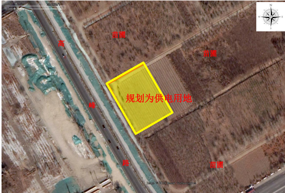
图 1.3-1 现状布局示意图（根据 2019 年 2 月 Google Earth 卫星影像图整理）